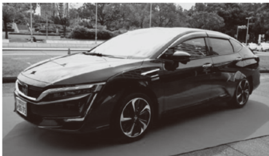
ホンダの新型FCV(燃料電池自動車) 「クラリティ フューエルセル」福岡県公用車

福岡市は家庭用燃料電池(エネファーム)やリチウムイオン蓄電システムなどの設置補助金制度があります。燃料電池の補助金制度について調査研究していくとのことですので、今後も調査研究結果を注視していきます。