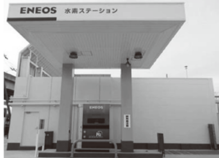
大野城市内の水素ステーション